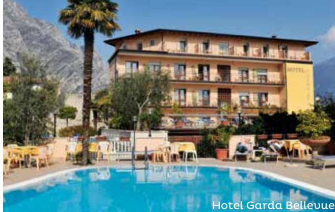
Hotel Garda Bellevue

Das bietet Ihr Hotel = Bar, Restaurant mit Pizzeria, Aufenthaltsraum, Schwimmbäder, Tennisplätze, Fußballplatz, Garten und Busparkplatz. Alle Zimmer mit Bad oder Dusche, Wc, Haartrockner, Telefon, Sat-TV, Safe, Klimaanlage.