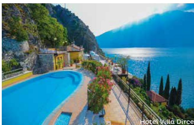
Hotel Villa Dirce