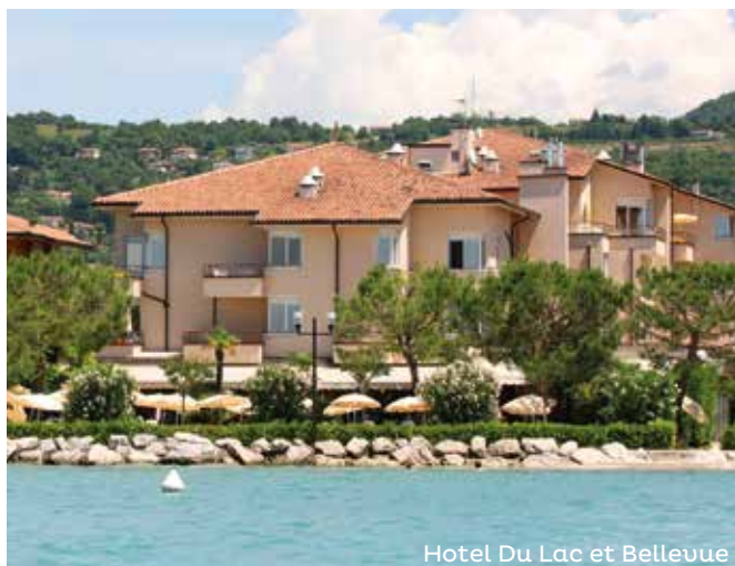
Hotel Du Lac et Bellevue

Das bietet Ihr Hotel = Bar, Restaurant, Aufenthaltsraum, Aufzug, Schwimmbad und Klimaanlage. Alle Zimmer sind mit Badezimmer mit Dusche, Haartrockner, Telefon, Sat-TV, Minibar, Safe und Klimaanlage ausgestattet.